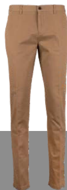
KURZ - UND LANG- GRÖSSEN